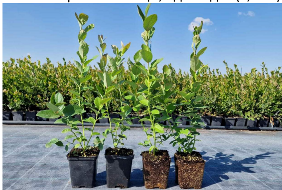
Контейнерные саженцы, одногодка (0,50 л)