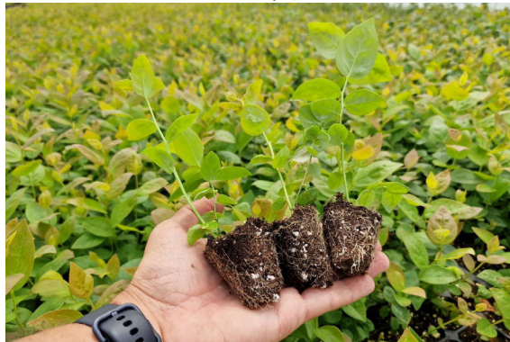
Кассетные саженцы, ячейка 45 мл